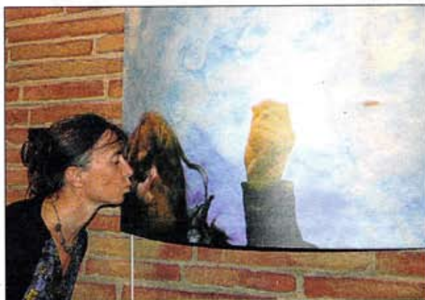
Pour les enfants, de nombreux d'ateliers photographiques

De par sa triple casquette, elle souhaite donner la recette du cocktail que forme la science, l'artistique et la musique. Et ça marche ! Il suffit d'aller découvrir l'exposition. Vous verrez les très nombreuses créations réalisées par le public. Vous lirez tous les messages qui accompagnent les photos. Ce-