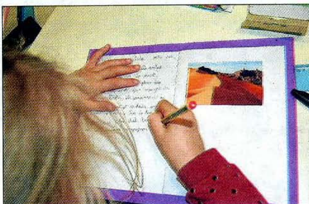
Les enfants créent leur livre de conte.