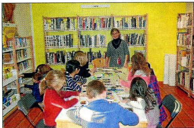
Ateliers d'écriture pour petits passionnés